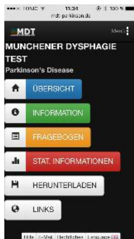
Abb. 2 MDT-PD Fragebogen (Teil III. – IV.)

Klinikern und Wissenschaftlern internationaler Krankenhäuser und Universitäten wird der MDT-PD in weitere Sprachen übersetzt ( Französisch, Italienisch und Chinesisch ), linguistisch und psychometrisch sowie diagnostisch validiert und auch auf seinen Einsatz bei atypischen Parkinson-Syndromen getestet. Zudem wird der Fragebogen in klinischen Forschungsprojekten sowie nationalen/europäischen Kohortenstudien mit unterschiedlichen Parkinson-Syndromen einbezogen.